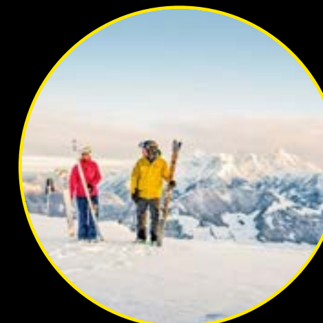
Netzwerken in den Kitzbüheler Alpen mit Roman Weidenfeller und Patrick Owomoyela