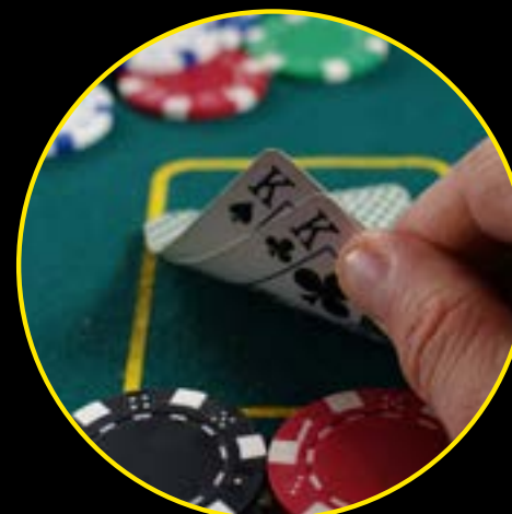
Pokernight im SIGNAL IDUNA PARK